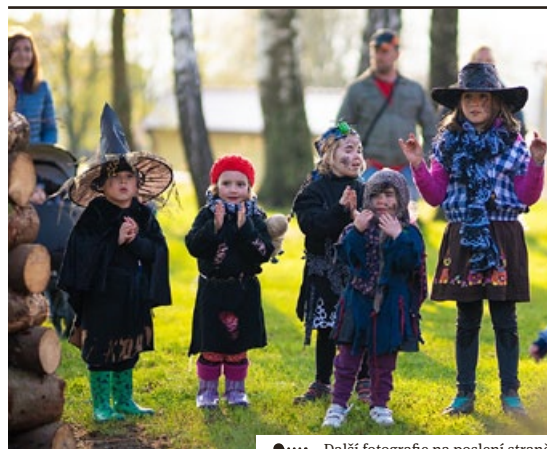
●..... Další fotografie na poslední straně

I přes chladné počasí se této akce zúčastnilo kolem 40 dětí v maskách a celková účast byla velice slušná. Rád bych tímto poděkoval všem dětem za jejich krásné masky čarodějnic, všem, kteří se této akce zúčastnili, dále pak našemu sponzorovi Městysi Kruceburk, MŠ za