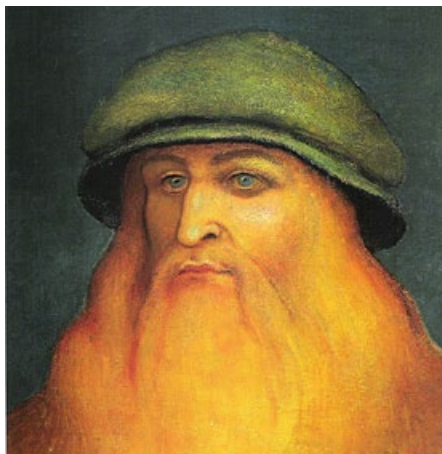
Jan Zrzavý: Podobizna Leonarda da Vinci , 1910 (nedokončeno), olej, překližka, Národní galerie v Praze

V kresbách uhlím s názvem Melancholie II a Přítelkyně z roku 1919 poznává oko diváka předzvěst pozdějších všeobecně známých olejomalb Melancholie II z roku 1920 a obrazu Přítelkyně z roku 1923. Záměrně vybírám tyto dřívější kresby uhlím, které ukazují, jakou tvůrčí cestou procházela tato témata, jak si malíř doslova vyhrál s celkovým vyzněním těchto kreseb, aby co nejvýstižněji vyjádřil svůj záměr. Než oba tyto obrazy mohly zazářit v celé své kráse ve finálním provedení olejomalby, pracoval se Jan Zrzavý k jejich duchovnému jádru.