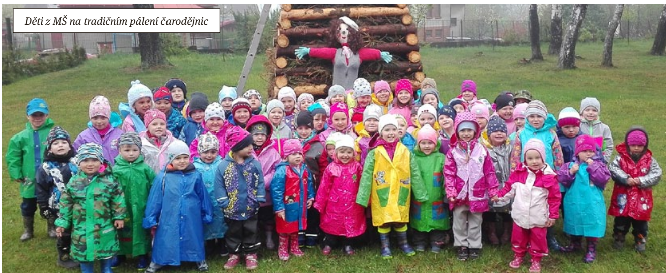
Děti z MŠ na tradičním pálení čarodějníc