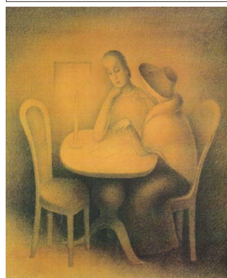
Jan Zrzavý: Přítelkyně , 1919, uhlí, papír, soukromá sbírka

beden. Skladník Hrubý ke mně přišel a podával mi nákladní list, že prý ty bedny jsou pro mě. ‚Co to je,‘ divil jsem se, ‚podívejte se, co to je!‘ Odrhli sekerou víko u dvou tří beden. Byly tam samé pastely, různé tóny růžové stupnice, a taky modré, bledě modré. V jiné bedně byly kusy jakési hmoty, na první pohled připomínala uhlí, ale pak jsem si všiml, že jsou modré, že je to indigo. Byl jsem strašně překvapen. ‚Kdo mně to asi posílá?‘ řekl jsem. ‚Podívej se do nákladního listu,‘ odpověděla Božka, ‚tam přeče musí být odesílatel.‘ Podíval jsem se. ‚Odesílatel Leonardo da Vinci,‘ stálo tam. Okamžitě jsem porozuměl.“ (Jan Zrzavý vzpomíná na domov, dětství a mladá léta. Praha 1971)