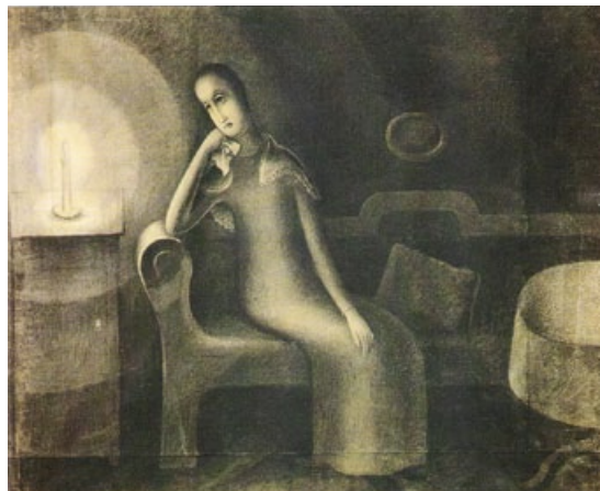
Jan Zrzavý: Melancholie II , 1919, uhlí, papír, soukromá sbírka