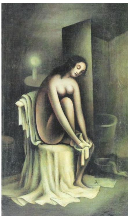
Jan Zrzavý: Po koupeli , 1919, olej, plátno, Husitské muzeum v Táboře

Olejomalba nesoucí název Po koupeli je prozářena cudnou umírněností, jemností, tělesnou krásou, kterou možno přirovnat ke skromně uzavřenému květu. Splývavá drapérie dodává výjevu kompoziční pracovitost.